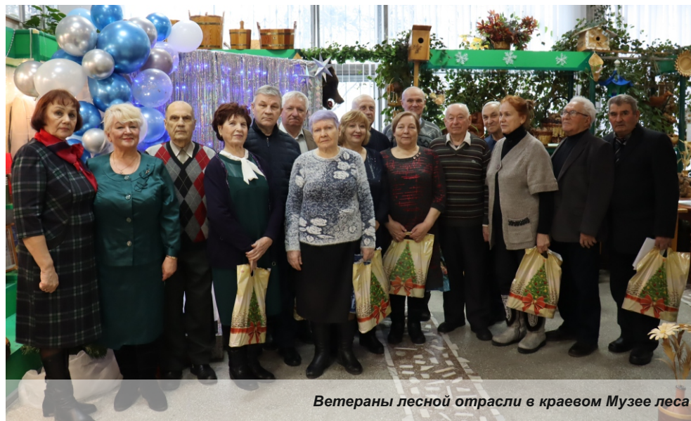
Ветераны лесной отрасли в краевом Музее леса

Сотрудники краевого Лесопожарного центра поздравили с наступающими праздниками семьи мобилизованных, ветеранов Великой Отечественной войны и труда