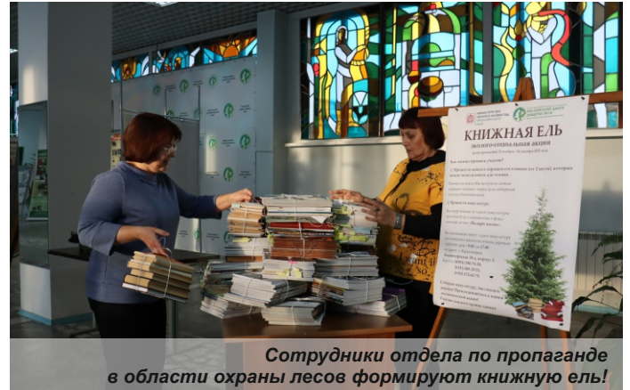
Сотрудники отдела по пропаганде в области охраны лесов формируют книжную ель!

Главная цель акции – привлечение внимания к вопросу бережного отношения к лесу и рациональному использованию природных ресурсов. Специалисты краевого Лесопожарного центра из Красноярска, а также Шарыповского и Енисейского районов собрали более 1000 книг и журналов, почти 500 кг макулатуры.