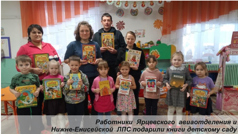
Работники Ярцевского авиаотделения и Нижне-Енисейской ЛПС подарили книги детскому саду

Сотрудники краевого Лесопожарного центра стали одними из самых активных участников акции «Книжная ель»!