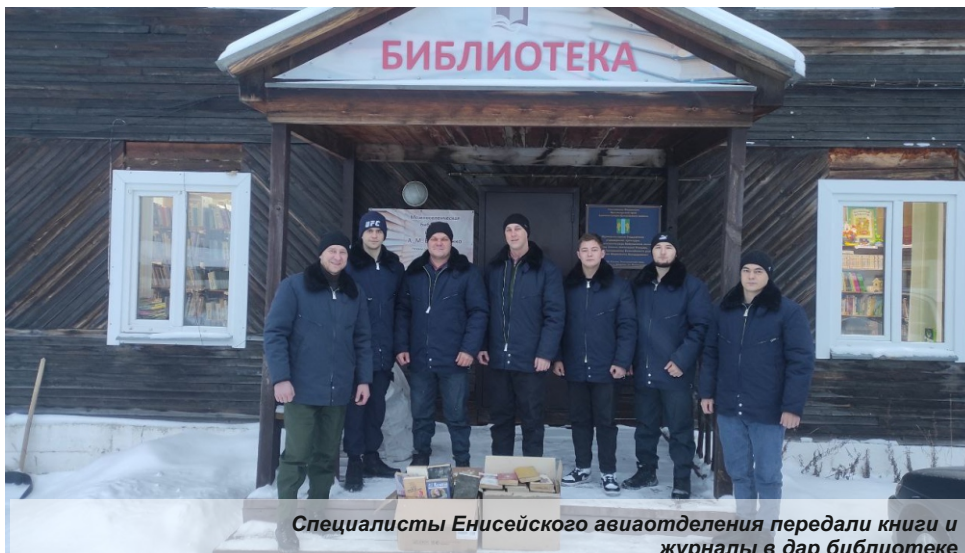
Специалисты Енисейского авиаотделения передали книги и журналы в дар библиотеке

– Кроме того, желающие смогут посадить, полученные в обмен на книги семена и вырастить деревья на своих приусадебных участках, тем самым внести свой личный вклад в восстановление лесов и улучшение экологической обстановки.